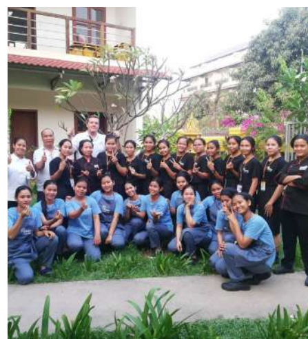
Atelier boulangerie avec Lesaffre Singapour