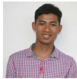
Srotom, Assistant social